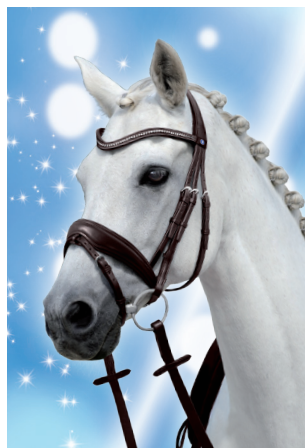
What a look! Die PASSIERBLU Trense Spirit in Havanna.

G. Passier & Sohn GmbH Am Pferdemarkt 8+10 · 30853 Langenhagen Verantwortlich: Dirk Kannemeier