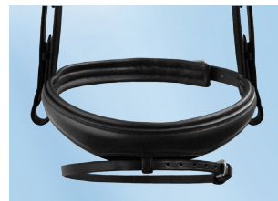
Die PASSIERBLU Trense Spirit in Schwarz. Mit glitzerndem Stirnriemen und anatomischem Ohrenausschnitt. Top: Sogar die Sperrriemenöse ist weich unterfüttert!